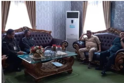
Pertemuan DPRD Bone Bolango bersama Bawaslu Kabupaten Bone Bolango.

Selain silaturahmi pertemuan Bawaslu dan DPRD Bone Bolango tersebut juga membahas anggaran Pilkada di tahun 2024.